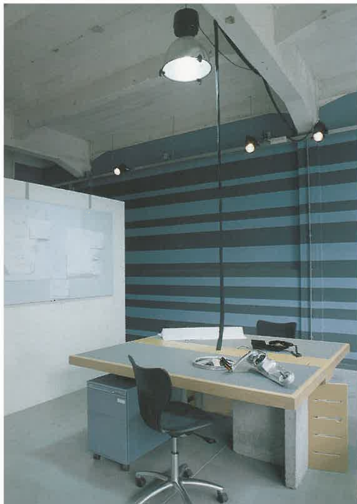
Werkruimte in studio 2: de strepen op de achterwand geven de ruimte dynamiek. De bureaustoel is van Akaba (via Car).