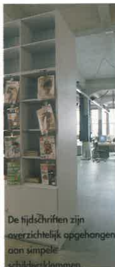
De tijdschriften zijn overzichtelijk opgehangen aan simpele schildersklommen.