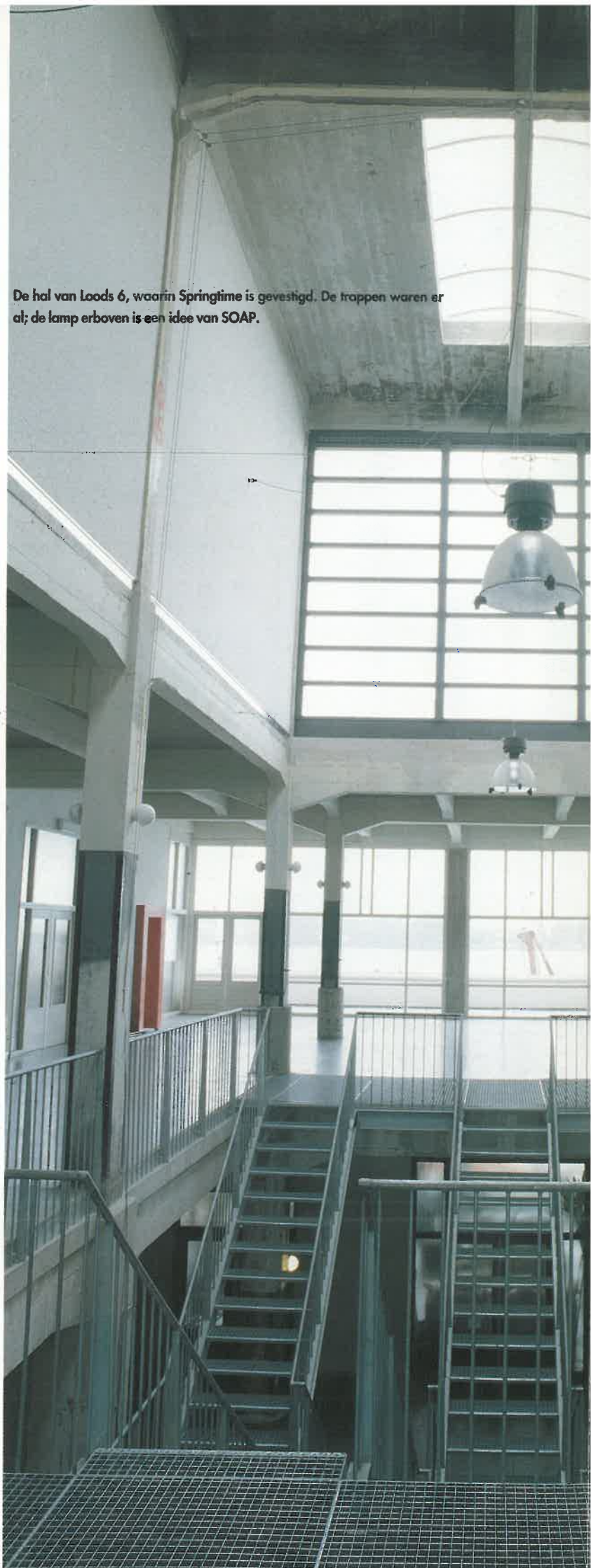
De hal van Loods 6, waarin Springtime is gevestigd. De trappen waren er al; de lamp erboven is een idee van SOAP.