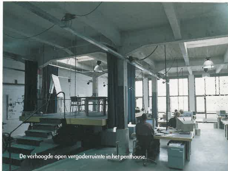
De verhoogde open vergaderruimte in het penthouse.

Linoleum werkbladen maken muismatten overbodig. Aan de wand: isolatiemateriaal ter verbetering van de akoestiek. BOVEN Het rek bij de receptie is grotendeels gevuld met door Springtime ontworpen fietsen.