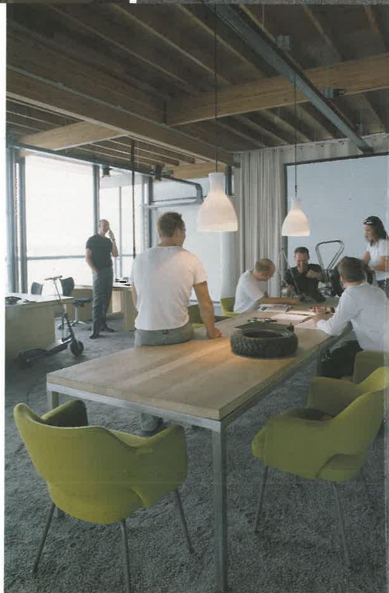
De presentatieruimte in het penthouse. De witte stoel en voetenbank - naast de boksbal - zijn van Pierre Paulin (Artifort via Bebob). De groene en de zilvere stoeltjes zijn ontworpen door Eero Saarinen.