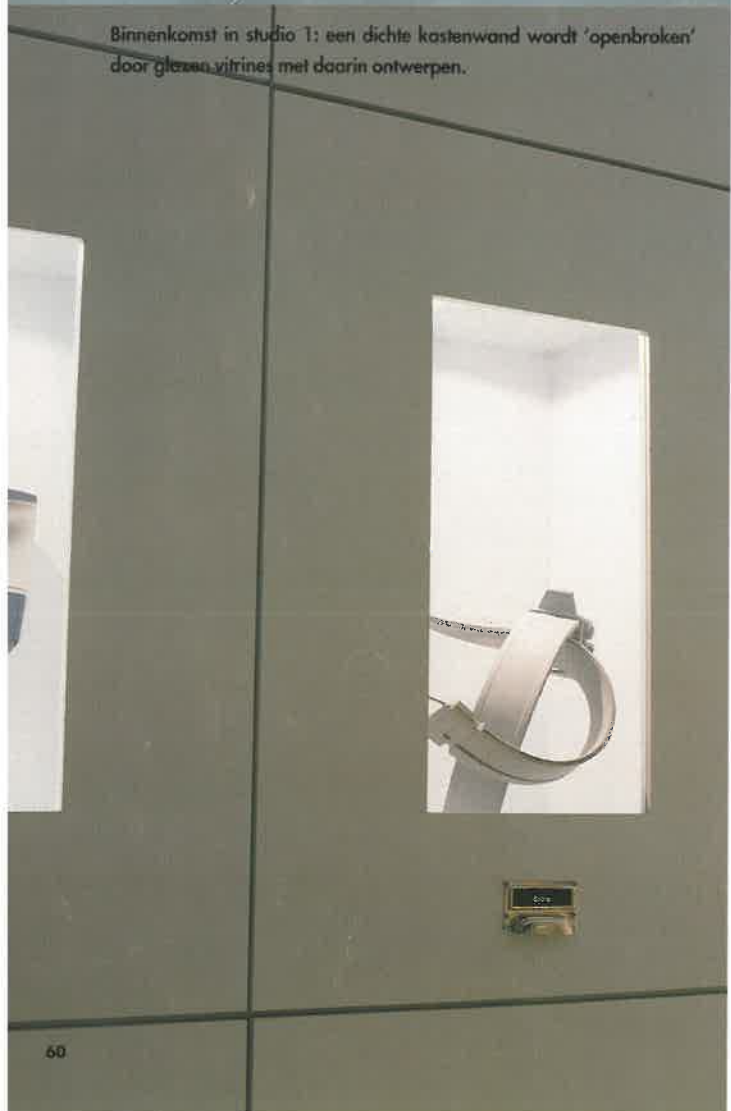
Binnenkomst in studio 1: een dichte kastenwand wordt 'openbroken' door glazen vitrines met daarin ontwerpen.