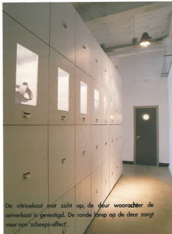
De vitrinekast met zicht op de deur waarachter de serverkast is gevestigd. De ronde lamp op de deur zorgt voor een 'scheeps-effect'.